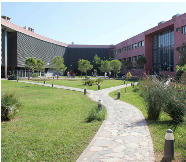
Universidad Pablo de Olavide en España