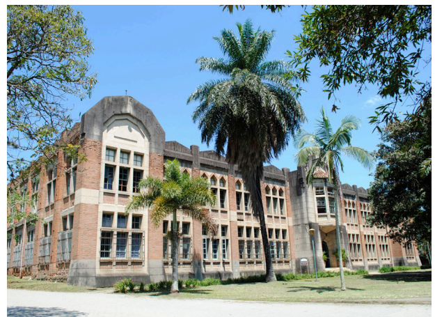
Universidad Nacional de Colombia, sede Medellín

programa universitario. La inversión para movilidad nacional es de 125 mil pesos por la UNACAR y 75 mil pesos en becas CUMex para un total de 200 mil pesos. Para movilidad internacional son 125 mil pesos en becas Santander y 100 mil de la UNACAR: 225 mil pesos en total. Esto se hace para que nuestros estudiantes puedan vivir esta experiencia única. Para nuestra institución máter la movilidad no es un gasto, es una muy buena inversión”, subrayó.