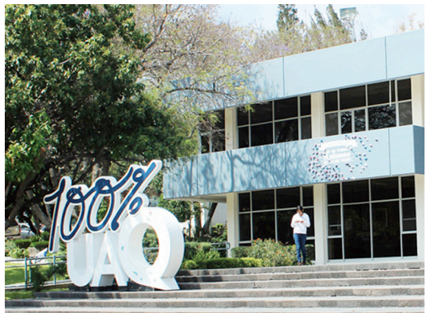
Universidad Autónoma de Querétaro